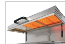
SEM 800 VC