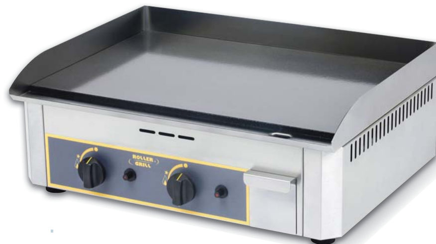
PSR 600 GE

Gas version : 1 to 3 star burners with 6 branches for even heat, control knobs with slow position, press button for Piezo lighting, safety thermocouples. Delivered in LPG with a set of NG injectors.