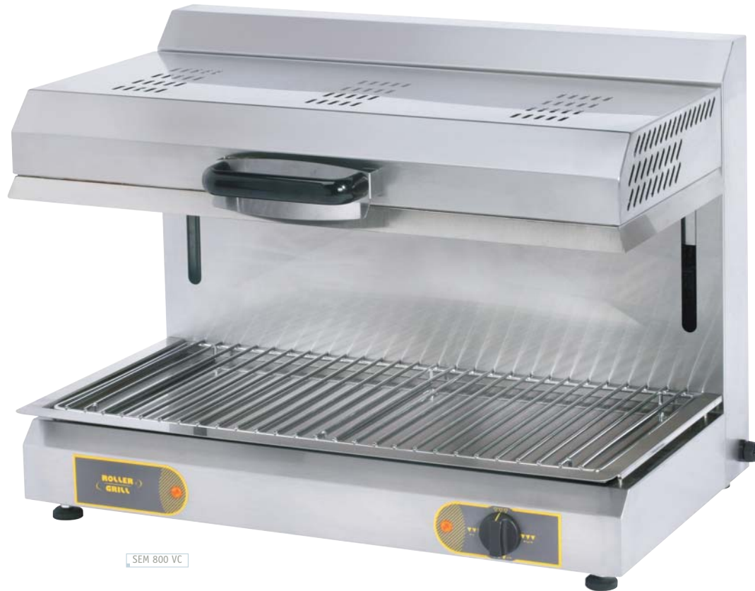
SEM 800 VC