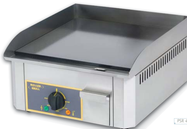
PSR 400 EE