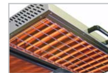
SEM 800 Q