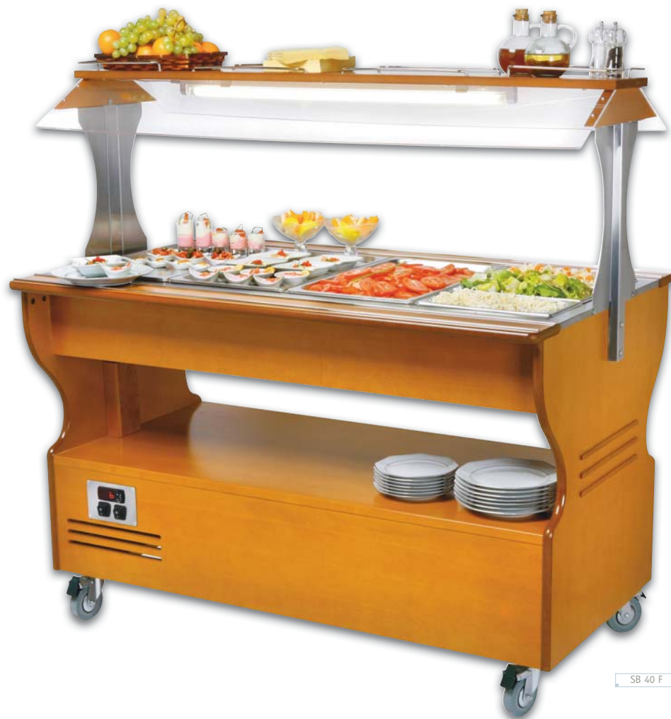
SB 40 F