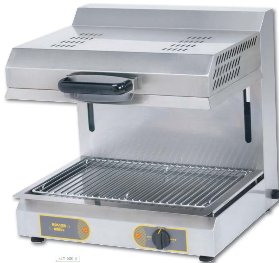
SEM 600 B

Easy and safe cleaning; easy access for any technical intervention.