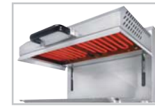
SEM 600 B