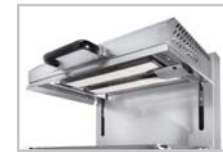
SEM 600 Q